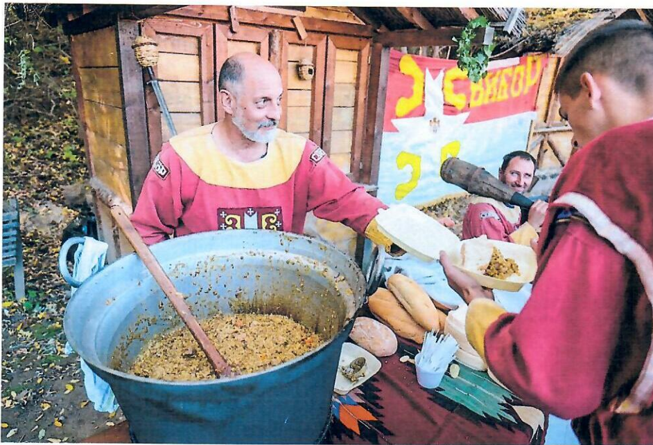
Слика бр. 8:

„Витешки дан” је представљао прави спектакл, не само као културни и историјски догађај, већ и као значајна туристичка атракција која је допринела популаризацији комплекса и увеличала интересовање за културно-историјске атракције општине Инђија.