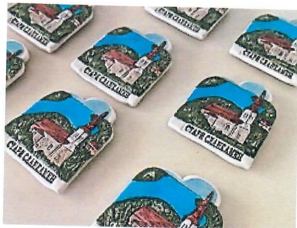
Слика бр. 3: Сувенир магнет Стари Сланкамен