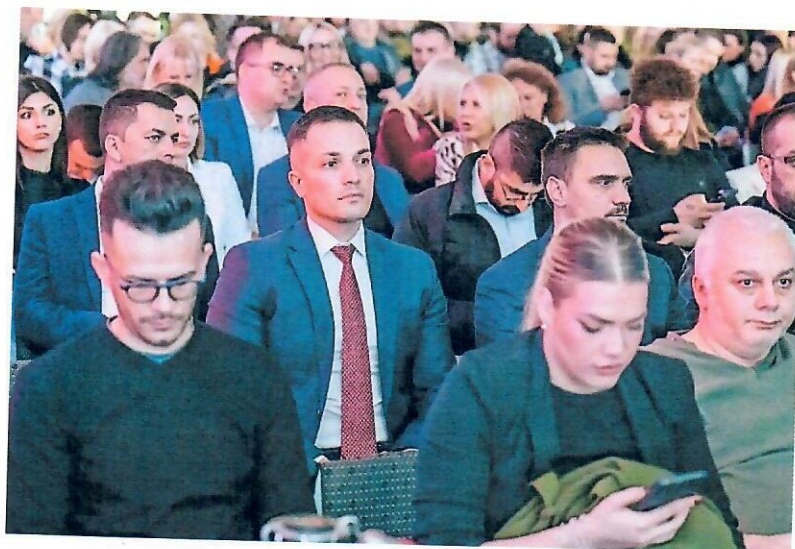
Слика бр. 5: