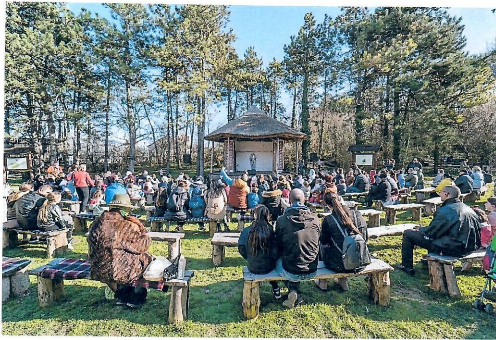
Слика бр. 3: Отварање нове сезоне у комплексу „Келтско село”

Унутар високом, дрвеном оградом опасаног комплекса налази се неколико типова келтских кућа, покривених трском и направљених од дрвета и блата, које представљају аутентична келтска домаћинства и занатске радионице. У једној од кућа смештен је и музеј са интересантним експонатима, базираним на материјалним остацима келтског племена Скордисци на подручју Срема.