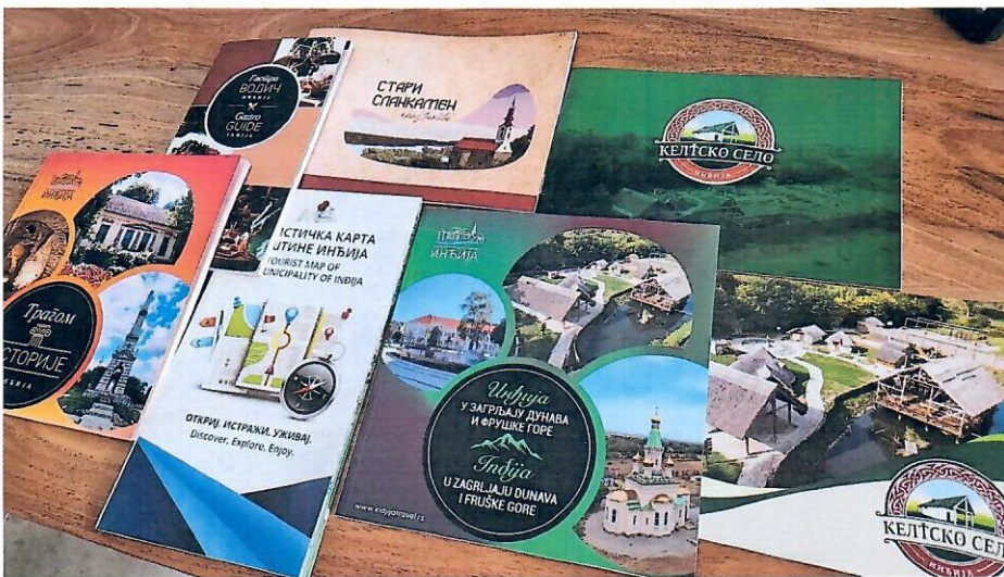
Слика бр. 1: Брошуре за сајам