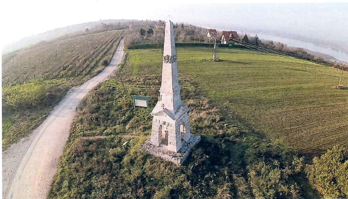
Слика бр. 7: