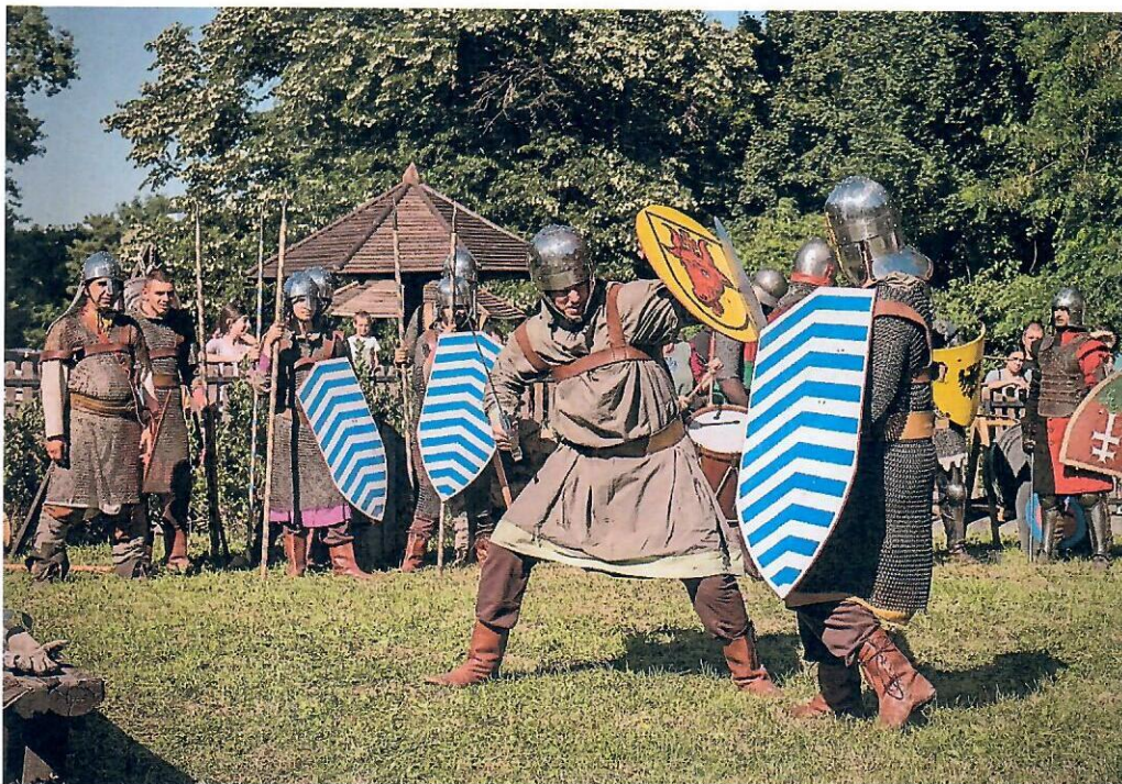
Слика бр. 4: Витешки дани у комплексу „Келтско село“

Изградњом додатних објеката и увођењем нових садржаја, значајно је унапређена понуда „Келтског села“. Викендом је комплекс био отворен за све посетиоце, док су радни дани били резервисани за организоване, најављене групе. Током сезоне 2024. комплекс је посетило око 220 група деце предшколског и школског узраста из целе Србије, као и Републике Српске. Са више од 15.000 посетилаца.