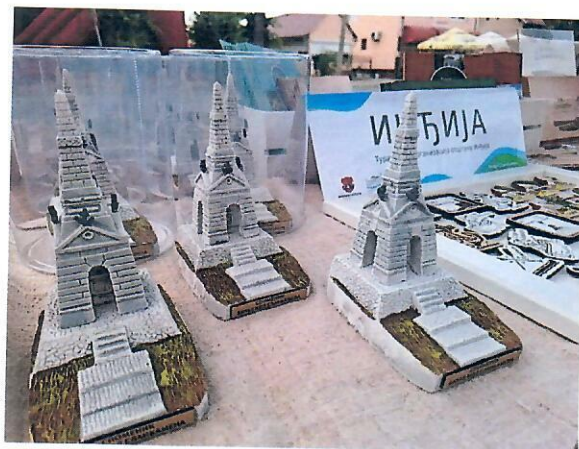
Слика бр. 2: Сувенир споменик битке код Сланкамена

Пример доброг, наменски израђеног сувенира је макета „Келтског села”, која верно приказује сам комплекс и представља један од најтраженијих производа у сувенирници.