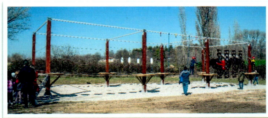
Слика бр. 4: Авантура парк у комплексу „Келтско село”

Изградњом додатних објеката и увођењем нових садржаја, значајно је унапређена понуда „Келтског села” што је утицало на повећање броја како организованих група, тако и укупан број посетилаца. Викендом је комплекс био отворен за све посетиоце, док су радни дани били резервисани за организоване, најављене групе. Током сезоне 2023. комплекс је посетило око