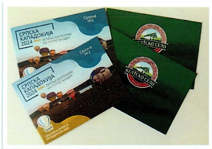
Слика бр. 1: Нове брошуре: „Келтско село Инђија” и „Српска Кападокија”

Учествовање на сајмовима и честа гостовања у телевизијским емисијама ради промоције комплекса „Келтско село” и почетка реализације пројекта „Српска Кападокија” односно отварање сезоне No. 1 летења балонима на топао ваздух на Крчединској ади, изискивали су снимање нових истоимених, промотивних филмова који су служили сврси.