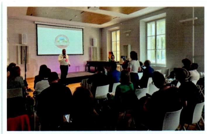
Слика бр. 5: Презентација комплекса „Келтско село” на додели „BIG SEE Tourism Awards” у Љубљани

250 група деце предшколског и школског узраста из целе Србије, као и Републике Српске. Са више од 35.000 посетилаца у прошлој години, премашен је број посета из 2022. године, што сезону 2023. чини веома успешном.