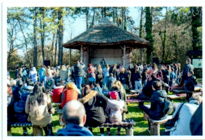
Слика бр. 3: Отварање нове сезоне у комплексу „Келтско село”

„Келтско село” је тематски туристички комплекс смештен у спортско-рекреативној зони Инђије, на уласку у град из правца Новог Сада. Инспирисан животом Келта на овим просторима пре око 2.300 година, комплекс је забавно-едукативног карактера и намењен је пре свега деци.