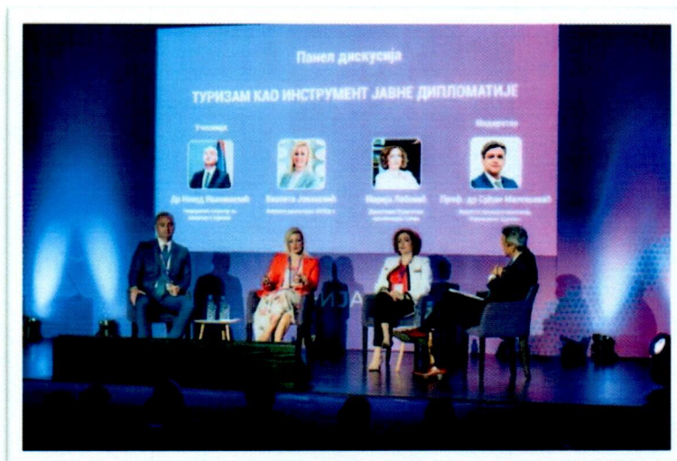
Слика бр. 6: Туристички самит Војводине у Инђији

организован је у Инђији. Ради се о другом по реду Туристичком самиту Војводине који је Туристичка организација општине Инђија организовала у сарадњи са Општином Инђија, Центром за едукативни развој Нови Сад, уз подршку Министарства за туризам и омладину, Покрајинског секретаријата за привреду и туризам, Покрајинског секретаријата за регионални развој, међурегионалну сарадњу и локалну самоуправу, Привредне коморе Војводине и Привредне коморе Србије.