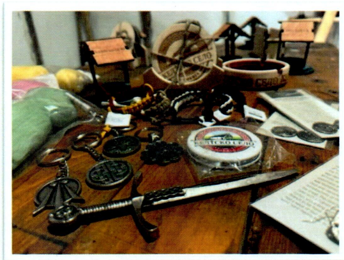
Слика бр. 2: Сувенири са келтским мотивима